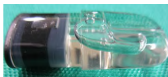
【エトミデートが含まれる製品の一例】